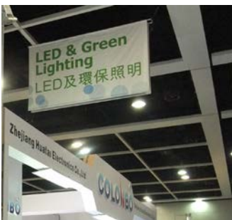
3b. Overhead hanging banner above booths