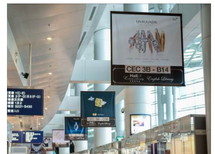
3a. 展馆一大堂的横幅广告