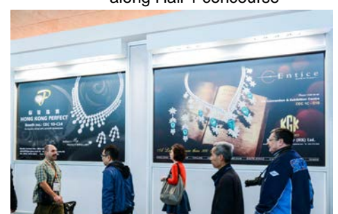
4. Hanging poster