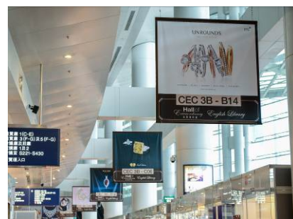
3a. 展館一大堂的橫幅廣告