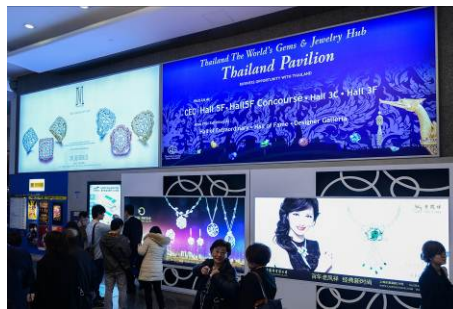
2. Lightbox at Harbour Road entrance