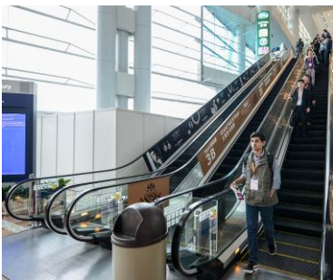
1. Escalator ad