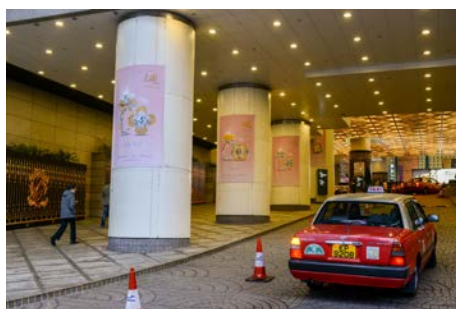
3c. 港灣道入口圓柱式橫幅廣告