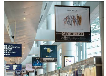
3a. Overhead hanging banner along Hall 1 concourse