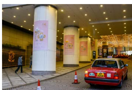
3c. Pillar banner at Harbour Road entrance