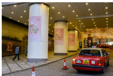
3c. 港湾道入口圆柱式横幅广告